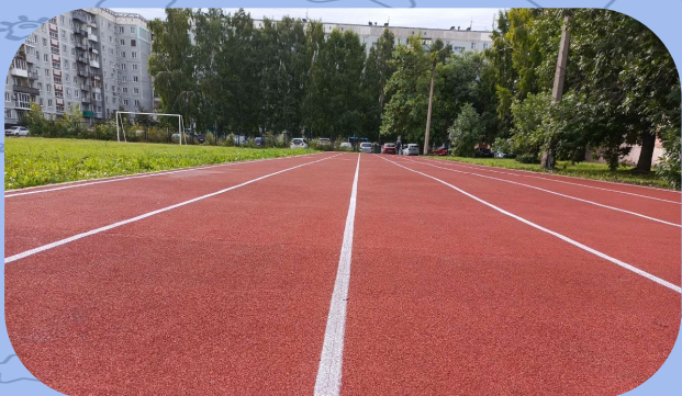
МБОУ «СОШ № 65»