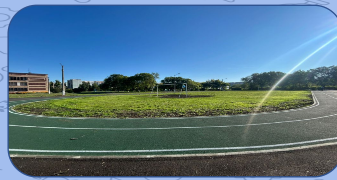
МБОУ «СОШ № 27»