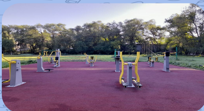
МБНОУ «Гимназия №44»