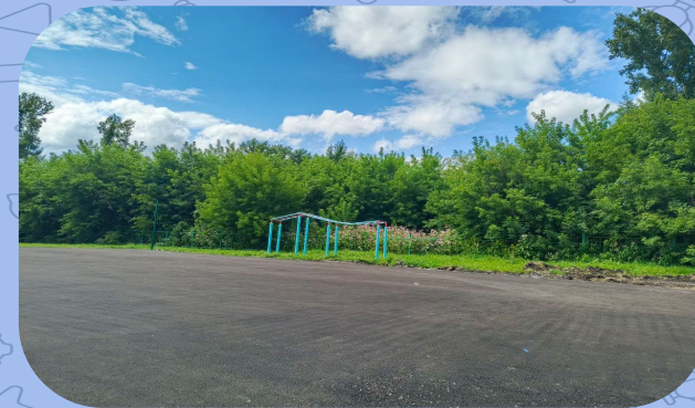
МБОУ «ООШ № 24»