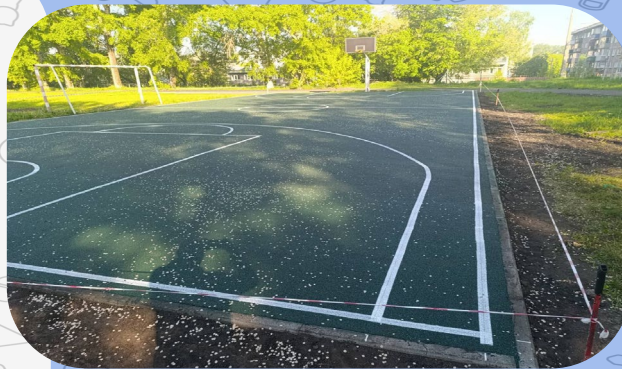
МБОУ «СОШ № 49»